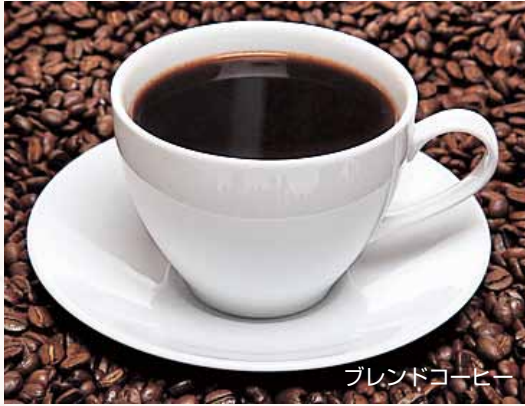
ブレンドコーヒー