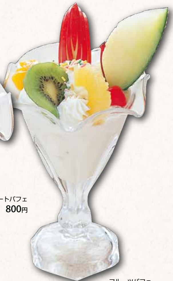
フルーツパフェ 700円