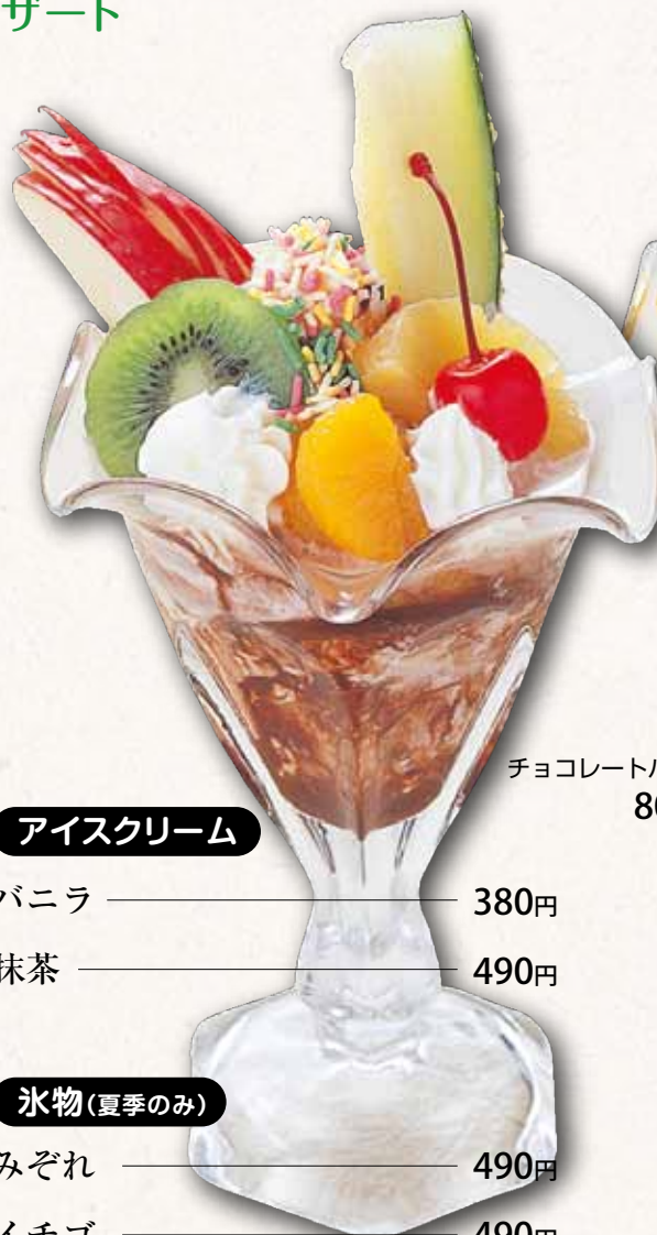
チョコレートパフェ 800円